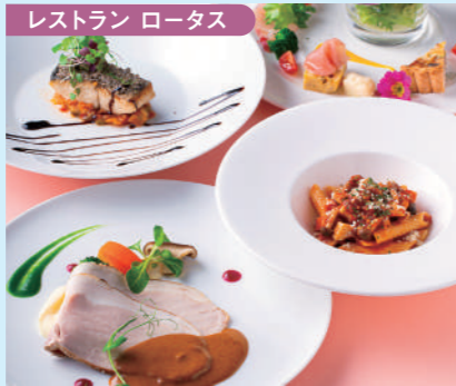
レストラン ロータス