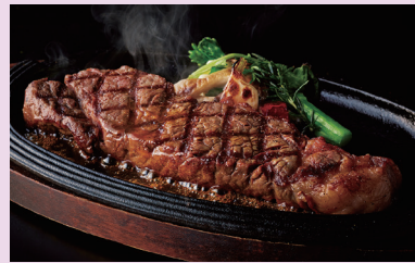
レストラン ロータス